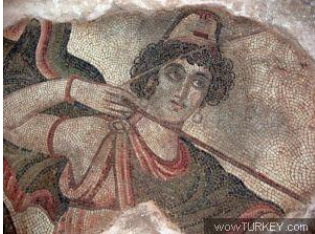
Ippolitt; Opa Leuzisi; Ulusun Opası, Başında Hitit(İsis, Susi) şapkasıyla.