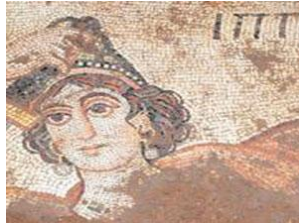
IPPOLİ-TTH; Hopalı Susi! MEL Anatt; Anası Ulu Ame, Lam Anası. (Lam-aba)