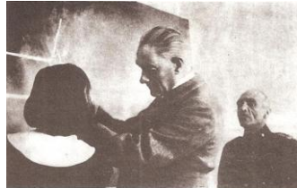
Mustafa Kemal, Kayseri’de bir öğrenciye geometri terimlerini öğretirken