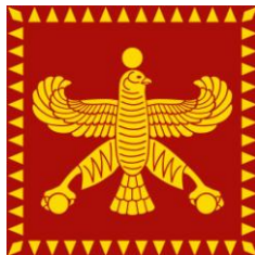
Akmenid döneminde tanrısal sembol